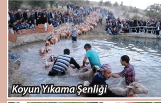
Koyun Yıkama Şenliği