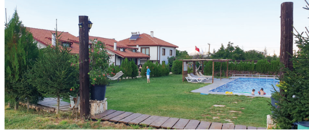
Tefenni ve çevresinde yer alan birbirinden güzel konaklama tesisleri konuklarına yıl boyu hizmet vermektedir.