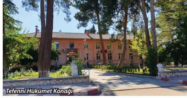
Tefenni Hükümet Konağı

28 TERSİNE SANI 335 (28 KASIM 1919) CUMA GÜNÜ TÜRK MARAŞ, SİLAH GÜCÜ İLE İNEN BAYRAĞINI İMAN GÜCÜ İLE YENİDEN DALGALANDIRDI.