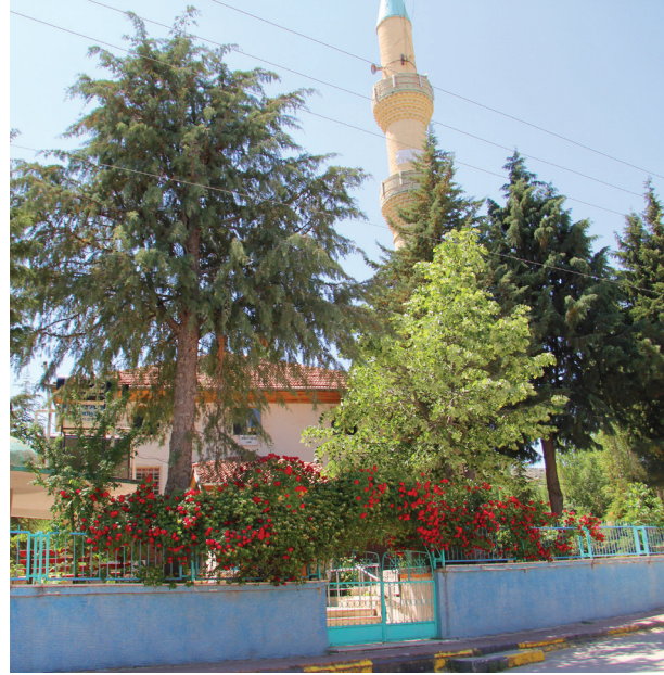
Ahşap kalemişi bezemeleri ile dikkat çeken Tarihi Merkez Yukarı Cami.