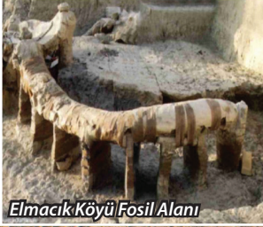
Elmacık Köyü Fosil Alanı