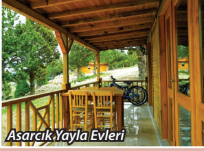
Asarcık Yayla Evleri