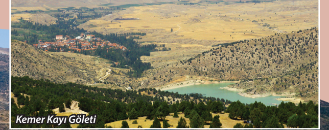
Kemer Kayı Gölleti