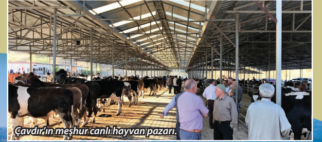
Çavdır'ın meşhur canlı hayvan pazarı.