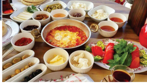
Çavdır sınırları içinde birbirinden lezzetli ürünleri ile konuklarını ağırlayan çok sayıda yolüstü tesisi bulunmaktadır.

İlçemize bağlı Bölmeşinar (Dengere) köyünde bulunan tarihi cami ne zaman yapıldığı bilinmese de bölgenin önemli tarihi ve kültürel değerlerinden biridir.