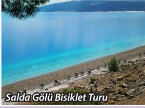
Salda Gölü Bisiklet Turu