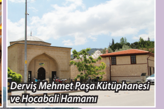
Derviş Mehmet Paşa Kütüphanesi ve Hocabali Hamamı