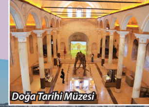
Doğa Tarihi Müzesi