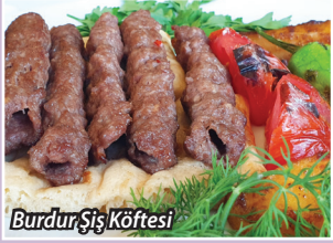
Burdur Şiş Köftesi

Burdur ve çevresinde bölgeye özgü değerleri yaşayabileceğiniz çok sayıda kaliteli tesis yıl boyu konuklarına hizmet vermektedir.