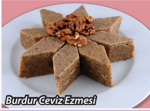
Burdur Ceviz Ezmesi