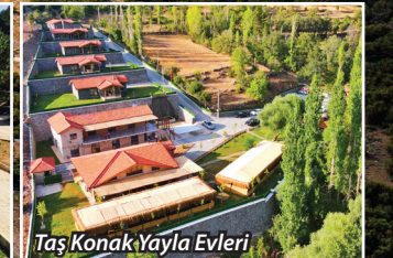
Taş Konak Yayla Evleri