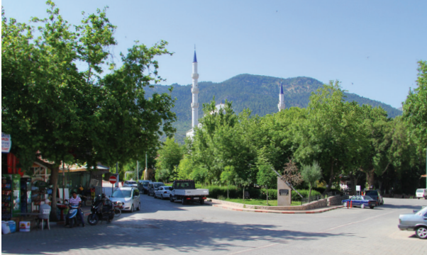
Altınyayla şehir merkezi.

1955'de belde olan ilçenin eski ismi Dirmil'dir. Dirmil, 1990 yılında ilçeye dönüştürülmüş ve adı da Altınyayla olarak değiştirilmiştir. Güncel nüfusu 5422'dir.