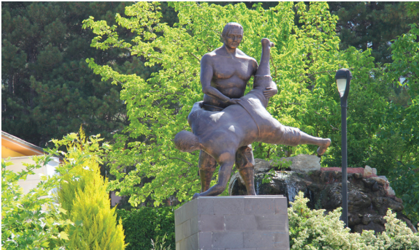
Altınyayla geneleksel sporları ve renkli folkloru ile bölgenin en şirin ilçelerinden biridir.