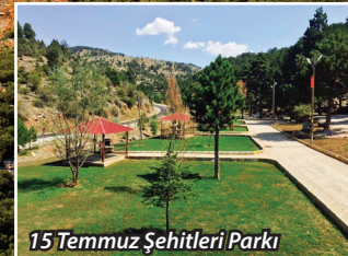
15 Temmuz Şehitleri Parkı