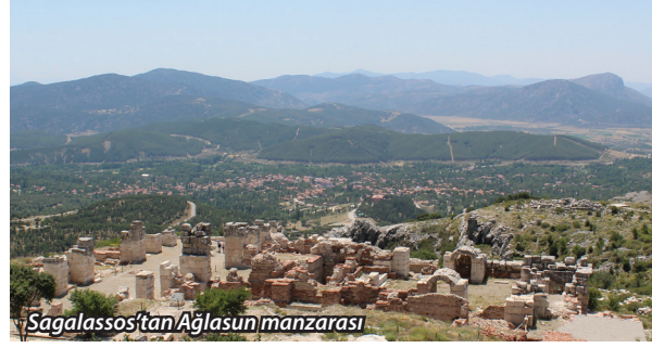
Sagalassos'tan Ağlasun manzarası