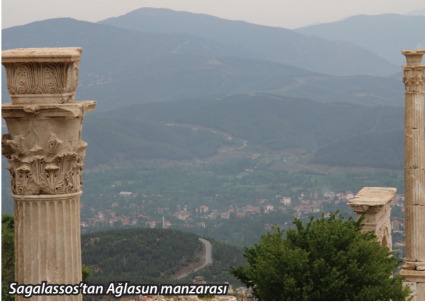
Sagalassos'tan Ağlasun manzarası