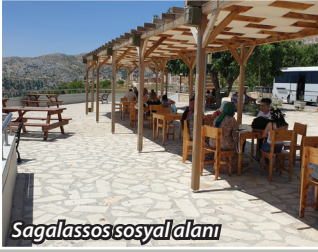
Sagalassos sosyal alanı