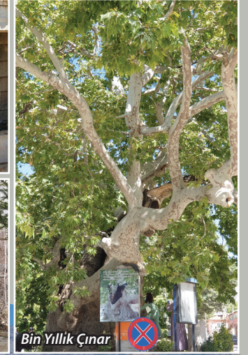
Bin Yıllık Çınar